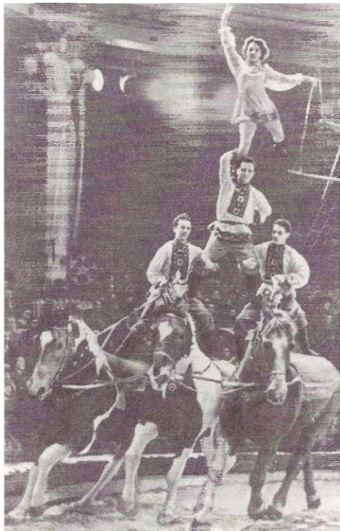
Фрагмент номера «Жокеи-наездники»

ступления ансамбля строились на сочетании акробатики и жокейской езды. Среди лучших трюков: одновременный прыжок трёх наездников на спину бегущей лошади («тройной курс»); «курс» всей труппы на двух лошадей, бегущих рядом; стойка верхнего на руках на голове партнёра, стоящего на крупе галопирующей лошади; в 1950 создал номер «Русская тройка» (реж. Г. С. Венецианов), в традициях конной дрессировки показывал разл. номера высшей школы верховой езды.